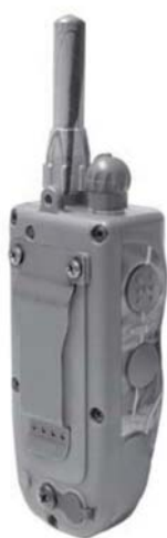
Bouton N et C sur le côté gauche de l'émetteur